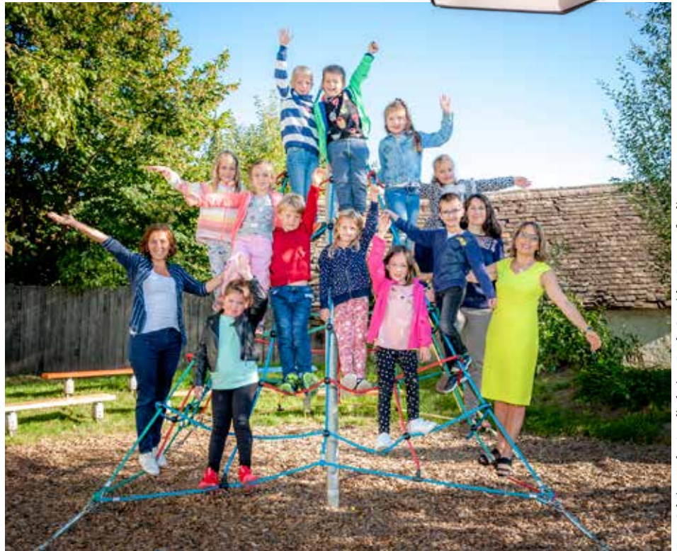
Foto: Sabrina Anker/mediadesign, Buch: Stanislav Popov - fotoit.a.com

ÖSTERREICH. Zum Thema Österreich arbeiteten die Schülerinnen und Schüler der 3. und 4. Schulstufe an verschiedenen Stationen und erfuhren dabei viel Spannendes.