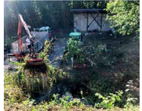
links: Die Landjugendmitglieder sowie VertreterInnen der Gemeinde freuen sich über das erfolgreich abgeschlossene Projekt im Johannessteinbruch. rechts: Mit schwerem Gerät wurde das Biotop von Schilf und Wildwuchs befreit.