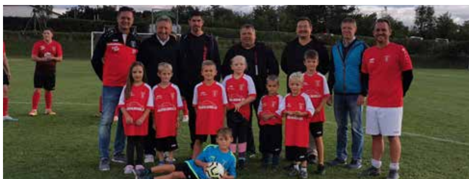
Glühbirne: vege - stock.adobe.com