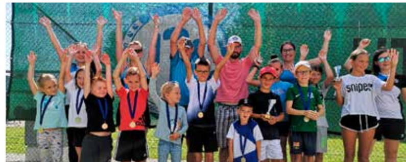
oben: Die erfolgreichen TeilnehmerInnen des UTC Open 2021. unten: Auch die Jüngsten zeigten, was sie draufhaben.