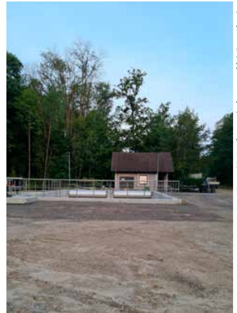
Kaum wiederzuerkennen ist die Kläranlage in Burgschleinitz. Die feierliche Eröffnung findet am 10. Oktober um 10:00 Uhr statt.