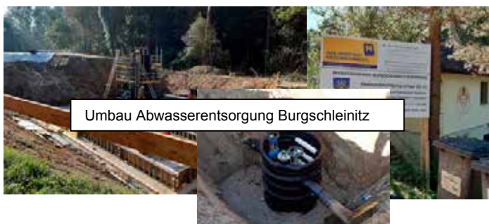
Umbau Abwasserentsorgung Burgschleinitz